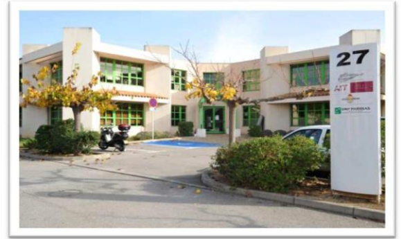
Parking Gratuit, nombreuses places

Parc Club du Millénaire Bâtiment 27 1025 rue Henri Becquerel 34000 Montpellier www.ait.fr Contact@ait.fr